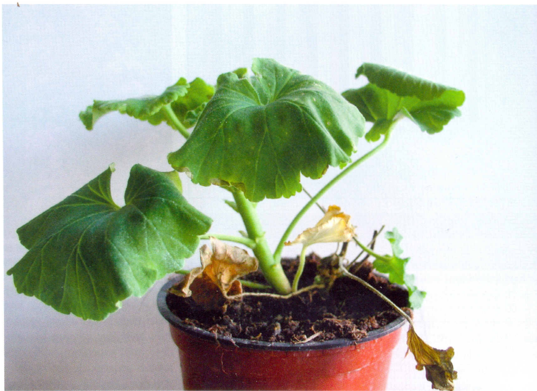
Vadnutí listů následkem infekce X. hortorum pv. pelargonii

Bakteriální listová a stonková hniloba nebo černá hniloba a bakteriální vadnutí jsou názvy, s nimiž je možné se setkat při označení choroby pelargonie vyvolané Xanthomonas hortorum pv. pelargonii (známé také pod označením X. pelargonii nebo X. campestris pv. pelargonii ). Patogen je kosmopolitně rozšířen a okruh hostitelů zahrnuje druhy rodu Pelargonium (zejména Pelargonium x hortorum , syn.: P. zonale , P. peltatum ) a také rodu Geranium ( G. palustre ), které patří k nejnámavějším. Kultivary P. graveolens se vyznačují střední citlivostí, podle některých autorů je Pelargonium x domesticum rezis-