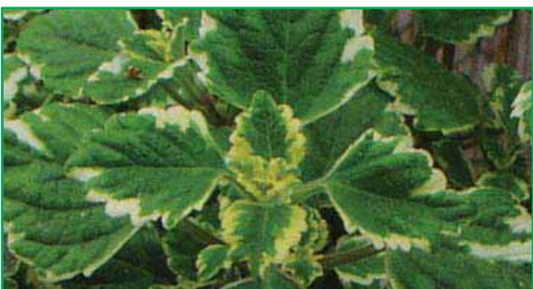
7770 Plectranthus coleoides