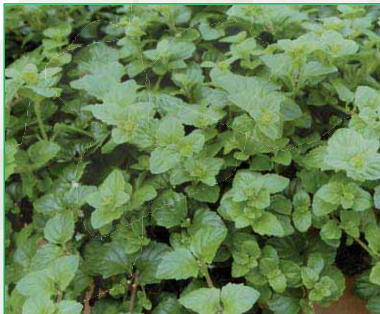
9050 Satureja douglasii Indian Mint