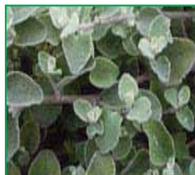
1845 Gnaphalium lanatum blau grünes Laub