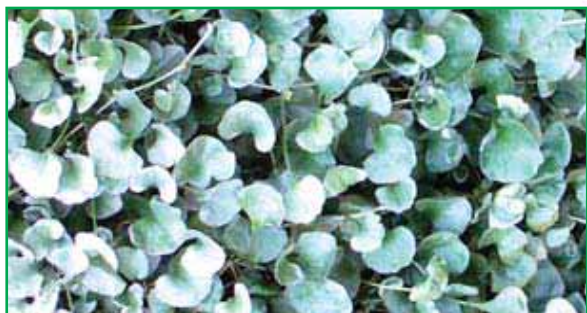
6920 Dichondra argentea Silver Falls