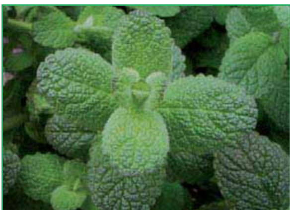
8010 Mentha rotundifolia 'Anasminze'