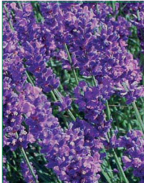
8005 Lavandula angustifolia 'Dark Hidcote Blue'