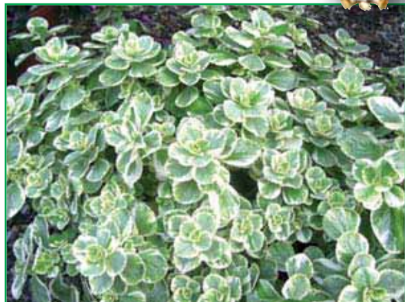
7779 Coleus Can. Hybride Verpiss - Dich variegata