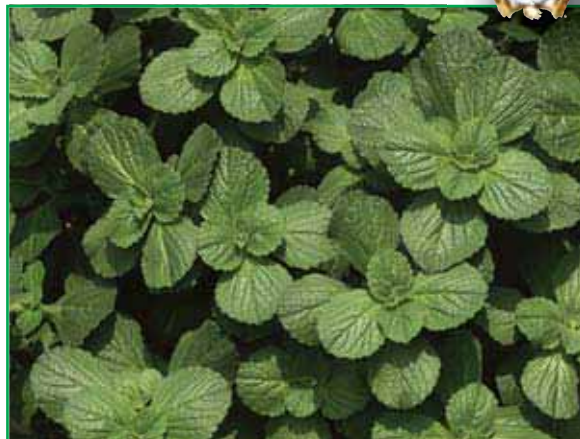
7780 Coleus Can. Hybride Verpiss - Dich Pflanze