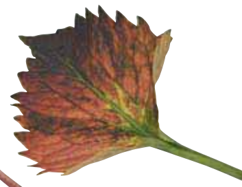
688 Tilt a Whirl