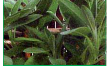
8043 Salvia officinalis