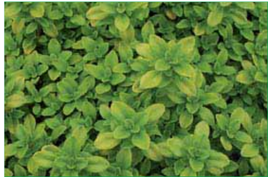
8087 Thymus citrodorus 'Bertram Anderson'