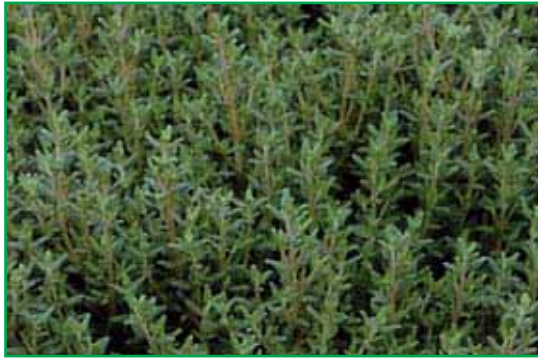
8064 Thymus vulgaris