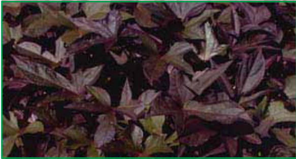
3755 Ipomea Rot