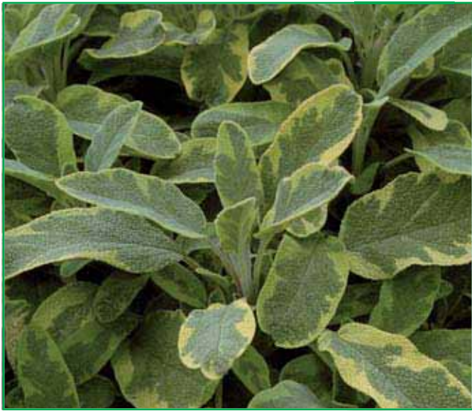
8054 Salvia off. 'Icterina'