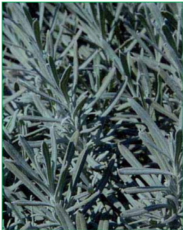
8003 Lavandula angustifolia 'Dwarf Blue'