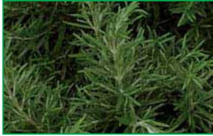
8035 Rosmarinum officinalis