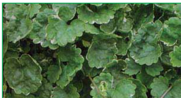
6768 Glechoma hederacea variegata (Nepeta)