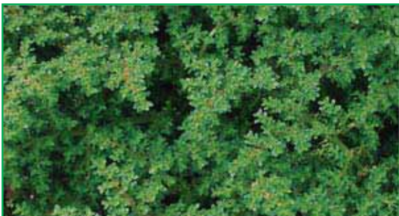
7990 Pilea microphylla