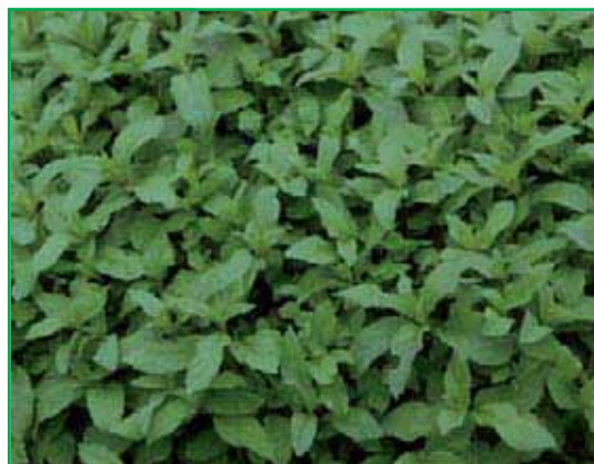
8012 Mentha piperita 'Pfefferminze'