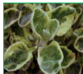
1847 Gnaphalium lanatum gelb grünblättrig