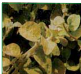
1846 Gnaphalium lanatum gelbblättrig