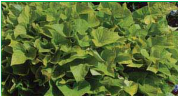
3756 Ipomea Gelb