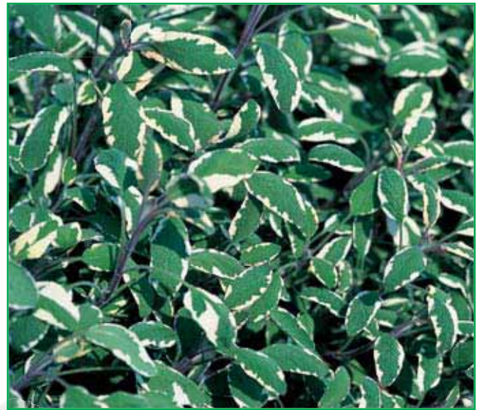
8049 Salvia off. 'Tricolor'