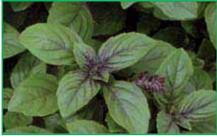
8095 Ocimum - Hybride (Basilikum)